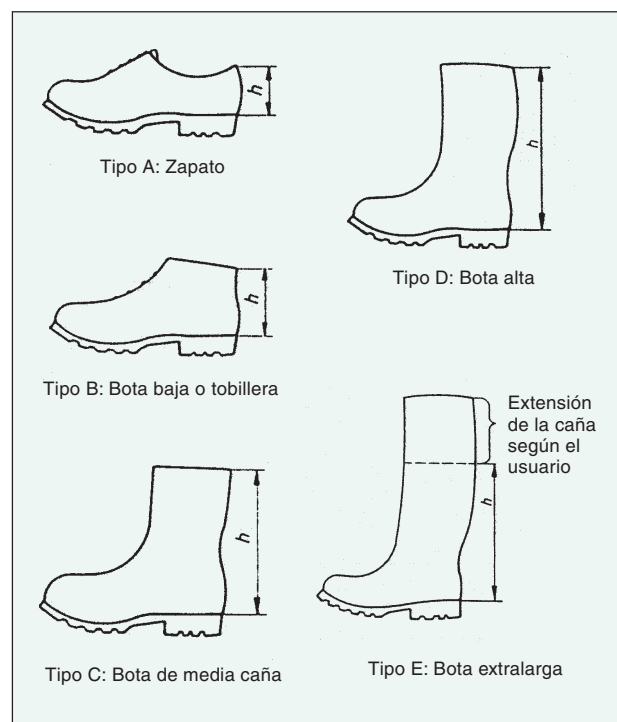
Figura 2. Diseños de calzados

La parte de la pierna que queda protegida por el calzado dependerá de la altura de la caña que éste presente. Así se pueden encontrar (según queda definido en las normas correspondientes) los diseños que se indican en la figura 2.