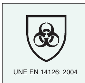
Figura 1. Pictograma y referencia de la norma